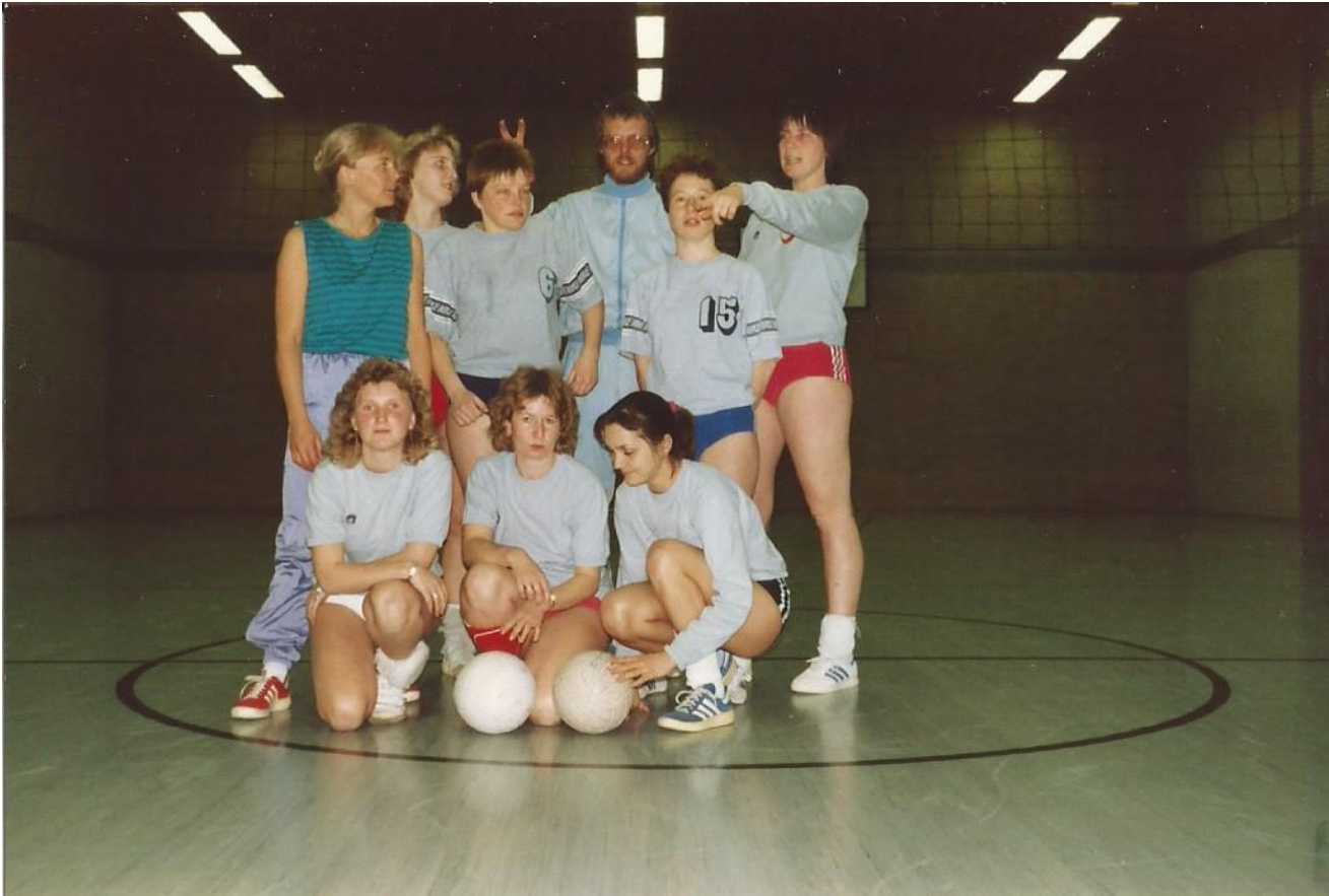
Auszug aus der Festzeitschrift 100 Jahre FT Geestemünde 1902 -2002