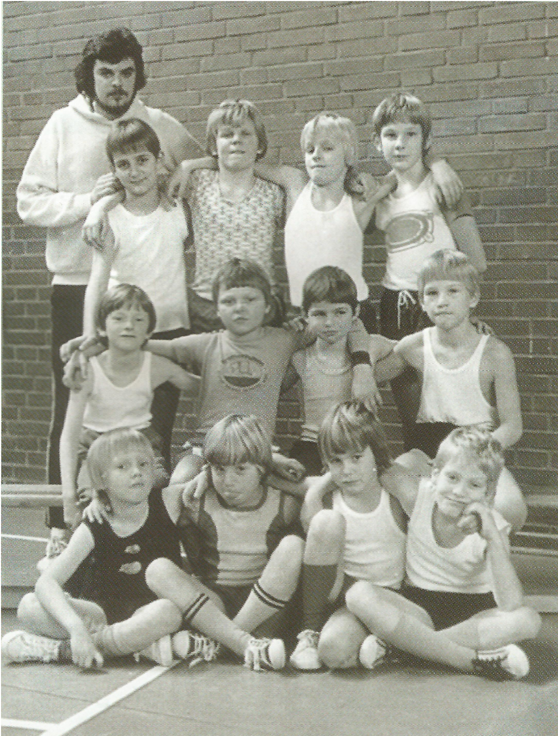
1978 riefen die Volleyballer der FTG dann auch eine Damen und eine Herrenmannschaft ins Leben.